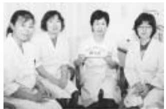
「ほっと」のスタッフ

九〇〇時間となりました。利用者数の増加にヘルパー数が追いつかず、お断りをしてしまいがち。地域の方に迷惑をおかけしているのが現状です。 第二回の養成講習も一月から予定されています。来年三月には養成講習を修了した新しいヘルパーが、即戦力として地域を訪問することになるでしょう。