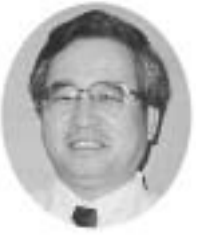
旧中野勤労者医療協会友の会の機関紙