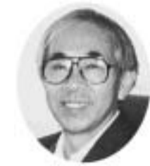
このたび、健友会と友の会の合同の機関紙が発刊され、会員のみなさまにお届けすることができるようになりました。