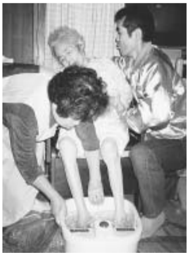
名、活動時間は月間三時間でした。