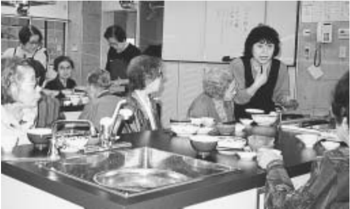
食べながら、食べたあと、みんなでお話するのが楽しい(共立友の会の「お食事会」)

「死にたい」「なにをしようか」と話した。お話し相手がいれば、川島友の会の「もしもしコール」はこんな言葉。