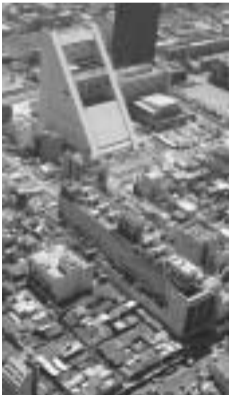
下の大きな建物がプロロードウェイ

「あ、した、てんきになれ!」といいながら下駄を蹴り上げた。深い草むらにもぐってしまつて泣きべそ。そんな思い出のあ