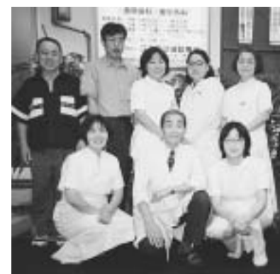
坂本所長(前列中央)とスタッフ

あり、また、くすみ・か すんだ時もありました。 しかし、地域の人のた ちの地域の人たちによる 診療所」という思いを込め て「江古田沼袋診療所」