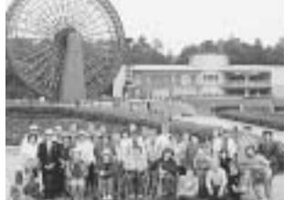
被爆者特設で辻所長と懇談