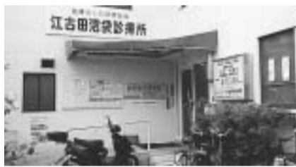
52年目に入った診療所。商 店街に近い住宅地にある。 現在の建物は38年前に建て られた。