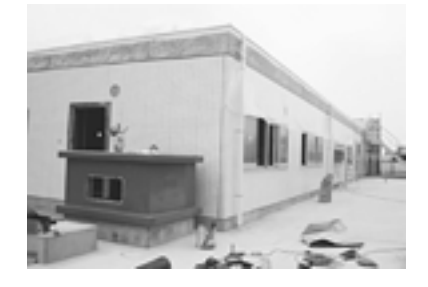
上・2・3階スタッフステーション 下・4階外壁 白タイル