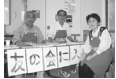
共立友の会外来窓口お誘い

10月より友の会拡大強化「月間」が全国の民医連の病院や診療所、介護事業所、薬局などで始まっています。職員と友の会は、病院建設を成功させる大きな土台として、この「月間」を位置づけ、友の会の仲間増やし5000世帯を実現しようとして取り組まれています。