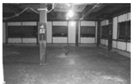
右上・透析室 左上・4階リハビリ室 奥 左下・2・3階 4床部屋