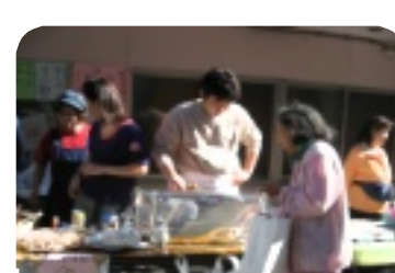
青年部の焼き鳥は職人技