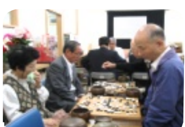
真剣そのもの囲碁将棋大会