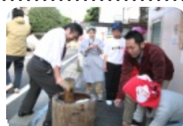
カいっばい餅つき