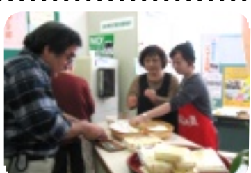
サンドイッチ&コーヒーコーナー