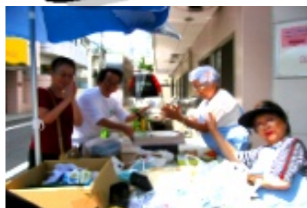
多くの方から協力をいただき品物はほとんど売切れ