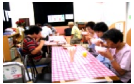
ダシがきいた豚汁、いとんが好評