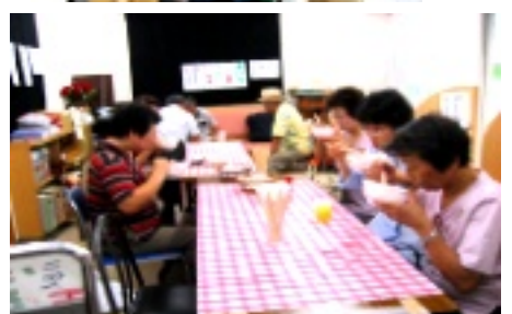
ダシがきいた豚汁、いとんが好評