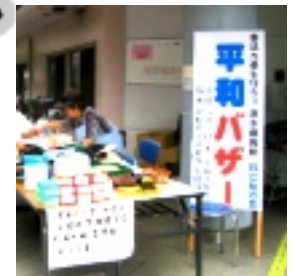
市場から直接仕入れたスイカ、巨峰、バナナ、トウモロシの新鮮さが人気