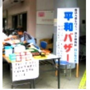
市場から直接仕入れたスイカ、巨峰、バナナ、トウモロシの新鮮さが人気