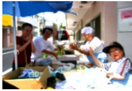
多くの方から協力をいただき品物はほとんど売切れ