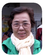
いちよ う並木 が素晴 らしかつ

キング日和。空からヒラヒラ、足下でカサカサと枯葉が秋を満喫させてくれます。多勢で歩くと気持ち自然と上がり、「うわーきれい」の歓声が聞こえる一日でした。