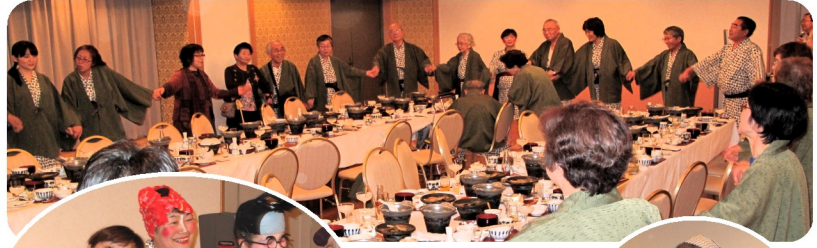
星影のワルツ♪ で輪になって

普段、旅行に行きづらいという方々 の本当に楽しそうな笑顔が見られ ました。 地域医療のみならず地域社会の 支え合いのためにも、このような 友の会旅行など友の会活動は必須 だと改めて確信しました。具合 が悪くなった方もなく、医師とし てあまり役に立たなかつた印象 ですが、全員無事でよかつたです。