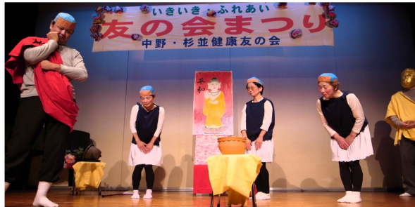
寸劇「小僧と毒入りの壺」

作品展 11/9~11 ・ 出展76人 ・ 来場者230人 芸能まつり 11/30 ・ 出演26演目 ・ 来場者216人