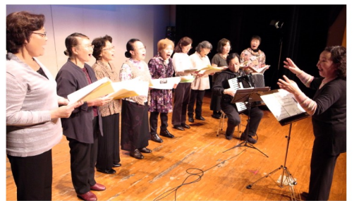
フィナーレを飾ったコーラス「花水木」