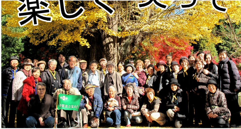
白水阿弥陀堂・大銀杏の前