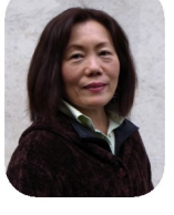
雨の 心配も なく絶 好のウオ