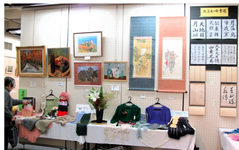
共立友の会の作品