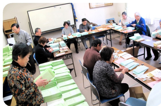
「健友」「友の会だより」3300部 発送作業に多勢のボランティア