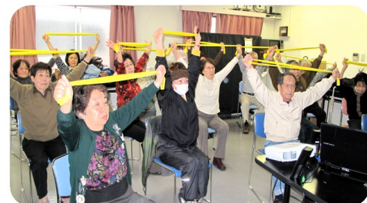
毎月1回ころばん・セラバン体操