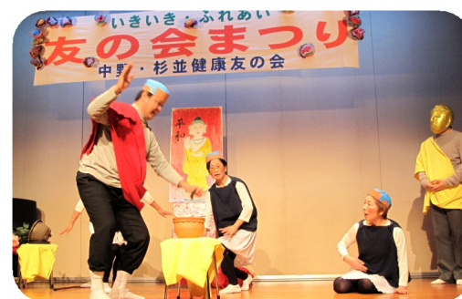
友の会まつり・寸劇「小僧と 毒入りの壺」に大笑い