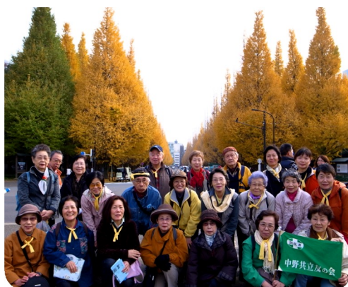
健康ウォーク・黄葉真っ盛り 神宮外苑の銀杏並木