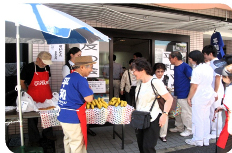
平和バザー・平和Tシャツで