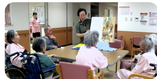
絵本読み聞かせボランティア 3階病棟で