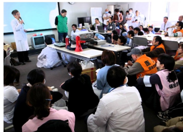
全国から駆けつけた民医連職員

人を超え、救急、外来、避難所・他事業所への派遣、地域巡回など、坂病院を地域の拠点として頑張っています。わたしは、支援物資を病院に運び分類し、病院の各部署や避難所などから求められる品物を準備しました。