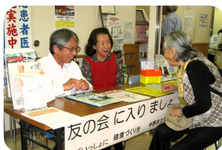
仲間増やし・待合室行動