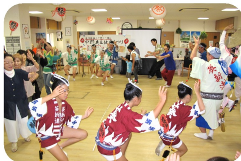
健康まつり・阿波踊りの登場 で一気に盛り上がり