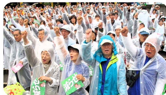
増やせ社会保障、減らせ国民負担 10・21国民集会に5,000人