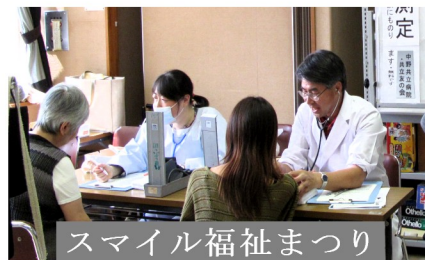
スマイル福祉まつり