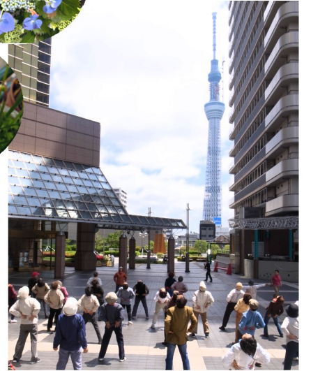
健康ウォーク・スカイツリー周 辺・道端の花にも季節を感じて