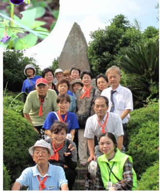
平和の旅・「慰軍従軍 安婦の碑」高台まで 頑張って登りました