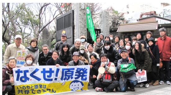
パレードに参加した職員・友の会のみなさん

被災地から3人の切実な現状報告があり、宮古市田老漁協の方の「大臣が何人来た？何を見ていったんだ。消費税を上げる前に、年金を切り下げる前にやっことがあるでねえか？復興が見えるようにしてけんねえか！」と怒りを込めた発言に「そ