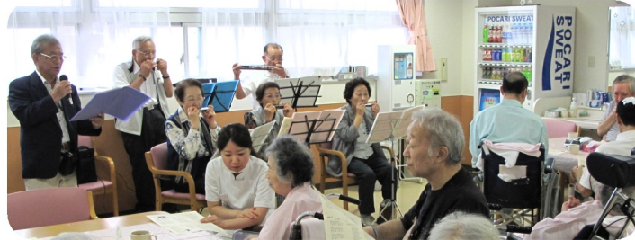
病棟定例お茶会・ボランティアのハーモニカ演奏