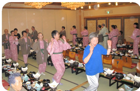
秋の旅行・宴会の最後 は炭鉱節で輪になって