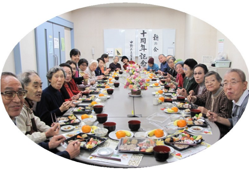
食事会「穂の会」・華やかに10周年