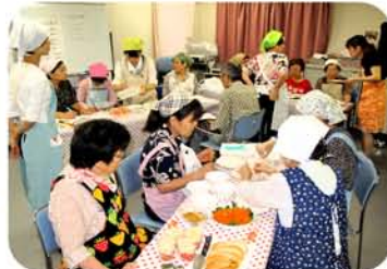
健康講座「レンジで簡単減塩料理」・家でも役立つアイデアが好評でした