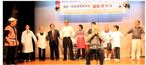
芸能まつり寸劇「本日特診生きがいつくり」・多いに笑って専務や事務長も出演