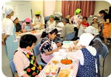
健康講座「レンジで簡単減塩料理」・家でも役立つアイデアが好評でした