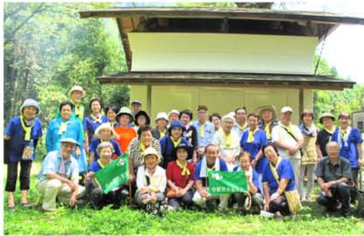
平和の旅「五日市憲法草案を訪ねて」・今日の平和憲法に通じる精神を学んだ旅でした