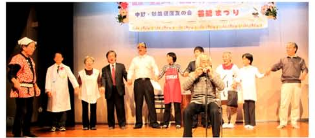
芸能まつり寸劇「本日特診生きがいつくり」・多いに笑って専務や事務長も出演