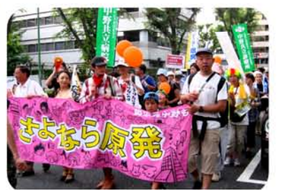
さよなら原発「中野も」・杉並に続き、鳴り物入りで楽しく