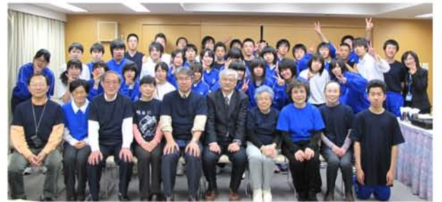
田老第一中学校(岩手県宮古市)の修学旅行で生徒、先生達と交流・被災地を忘れず支援しましょう