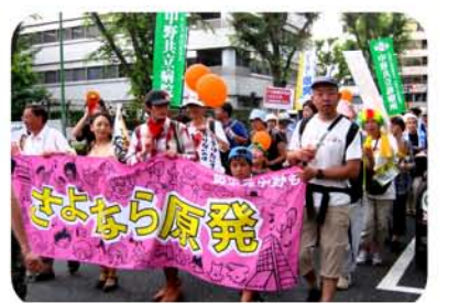
さよなら原発「中野も」・杉並に続き、鳴り物入りで楽しく