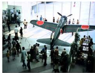
遊就館に展示されている零戦