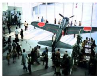
遊就館に展示されている零戦

当日は暑い日でしたが、車いすの方もおられ、決して若いとは言えない方々なのに、途中で帰る人はありませんでした。見学場所が無関心ではいられ