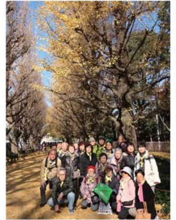
「健康ウォーク」・神宮外苑の晩秋の銀杏並木を楽しみました