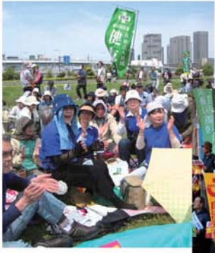
「5・3憲法集会」(左)「原発ゼロの未来へ3・4全国集会」(右)に参加