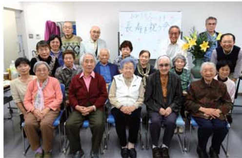
「長寿を祝う会」・友の会を支えて下さる長寿の方々(最高齢95歳)をお招きしお祝いしました