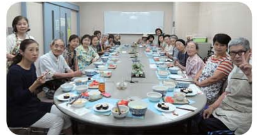
食事会「穂の会」・優しい味の家庭料理が楽しみ(上)、食事会「あした」・薬膳料理を参考にした季節の旬のメニュー(下)