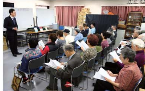
シリーズ「終活講座」第3弾・毎回多くの参加者があり、自分の問題として質問も真剣そのもの