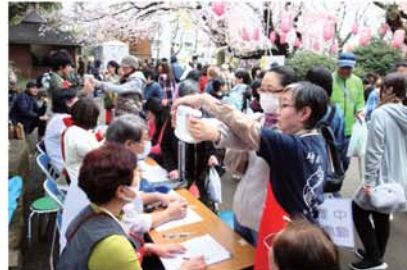
「まちかど健康チェック」・新井薬師公園内のさくらまつりで130人の健康チェックを行いました