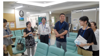
訪問の打ち合わせをする職員

室内でも熱中症になるおそれがあります。エアコンをうまく使しましょう。共立診療所でも、毎年熱中症の啓発訪問を行っています。ご近所同士でも声を掛け合って、元気を夏を乗り切りましょう！