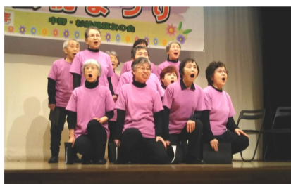
大迫力の朗読は「走れメロス」