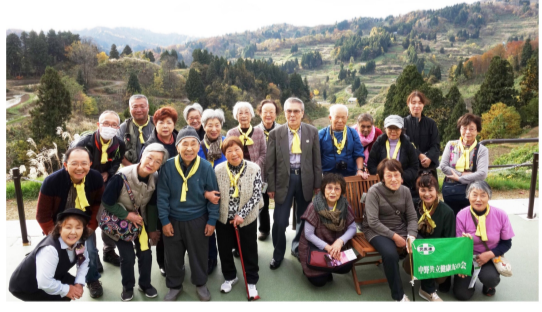
山古志伝統の棚田を背に

晴天に恵まれた秋の日。11月14日~15日で秋の友の会 旅行が行われました。2004年に起きた中越地震の被害 に見舞われた山古志村を訪問し、夜は月岡温泉へ。 「宿がとってもよかった!」と大評判でした!