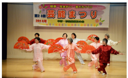
太極拳、扇がビシッ！