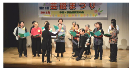
優しい歌声にうっとり