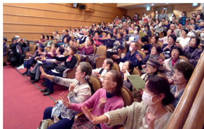
会場は座れないほど超満員

11月21日、なかの芸能小劇場で9つの友の会合同の芸能まつりが開かれました。多彩な演目が披露され、出演者も観客も一体になって楽しみました。これを読むあなたも来年は出演してみたいはかがでしょうか？