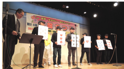
職員の出し物は…超能力？！