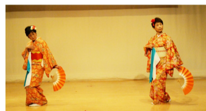
日舞は手ぬぐいで艶やかに