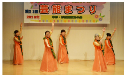
思いを伝えるフラダンス