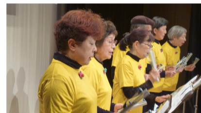
トーンチャイムのやさしい音