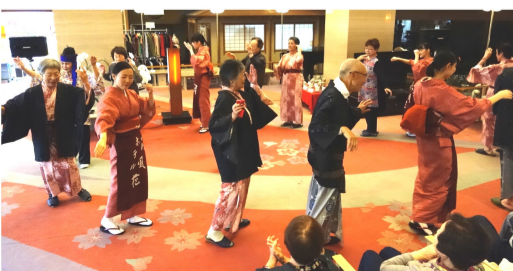
月岡温泉で仲居さんと炭坑節