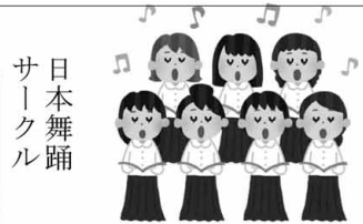
日本舞踊 サークル