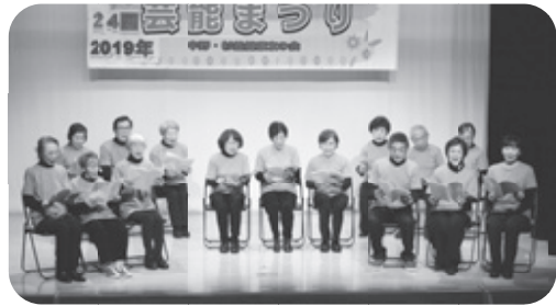
朗読サークルの皆さん

先生のご行為は令和元年の掉尾を飾る芸 能まつりに素晴らしい思い出を刻んで頂 きました。ありがとうございました。そ して今日の良き日を美しい思い出としま