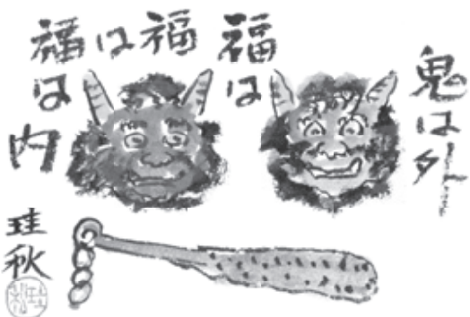
中野区沼袋 江田 喜久雄