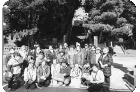
「健康ウォーク」山手七福神めぐり。