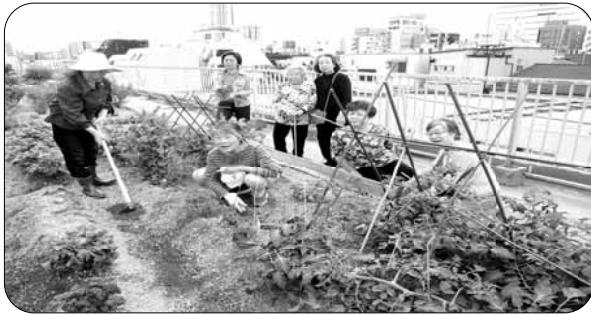
中野共立病院「屋上庭園」の作業の様子