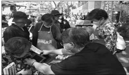
「中野通りさくらまつり」での健康チェック。