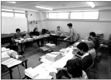
「友の会だより」「健友」も会員のボランティアで発送・手配りしています。