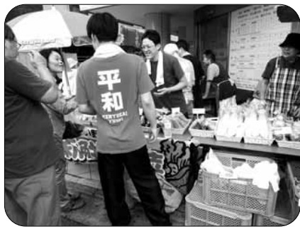
7月25日の「平和バザー」