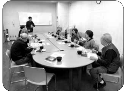
食事会「穂の会」みんなで食事するのが楽しみです。