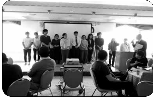
「中野共立健康友の会・総会」で新入職員を歓迎しました。