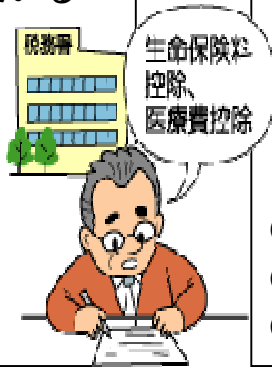
表2〔これは申告できる医療費?〕