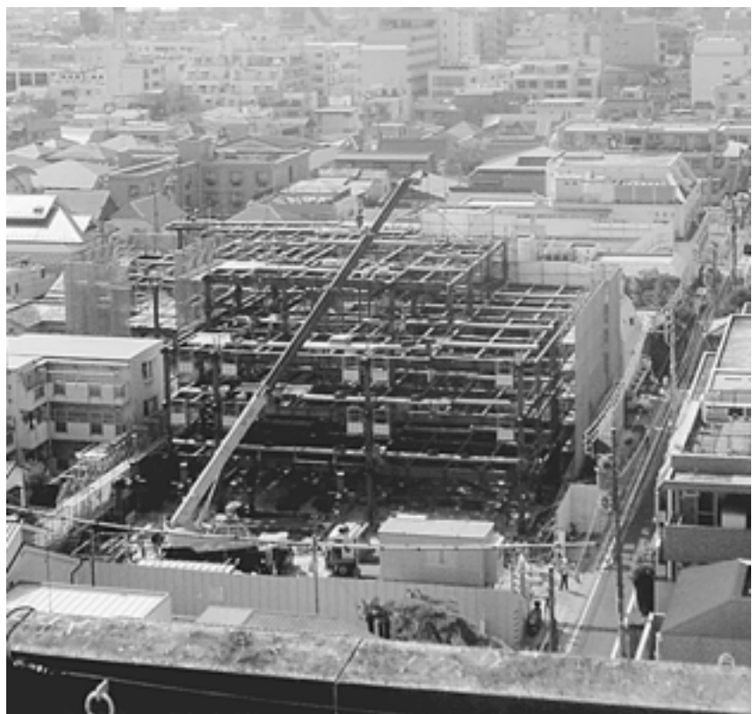
鉄骨組立工事は8割完成 (8月29日)

薬局に行く人が鉄骨組を見上げながら「早く出来ると良いね。」など声がかけられたり、「現在は他の病院にかかっているが、病院ができたらい