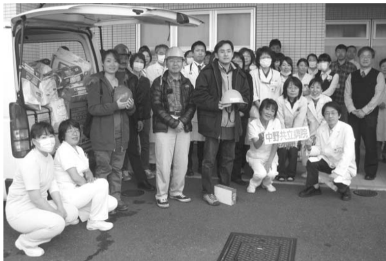
第2次支援チームと送り出す健友会・東医研の職員

た薬局を は被災し た。薬剤師 お話を聞 きまし を切り、 拭き、爪 の髪を のベトベ は、女性 のベトベ トの髪を 拭き、爪 を切り、 お話を聞 きまし た。薬剤師 は被災し た薬局を