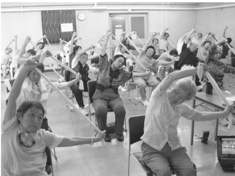
セラバンドを使って上半身の体操中

いいですとされているので、無理せずやっています。みなさんも一緒にやってみませんか。