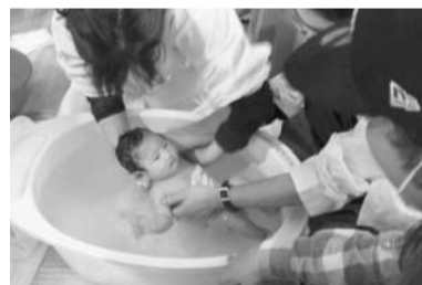
避難所で2週間ぶりに沐浴ができた赤ちゃん

師が現地へ。2週間、医 療支援を行いました。3 月16日からは、宮城県塩 釜市の坂総合病院などへ 支援チームを派遣しまし た。