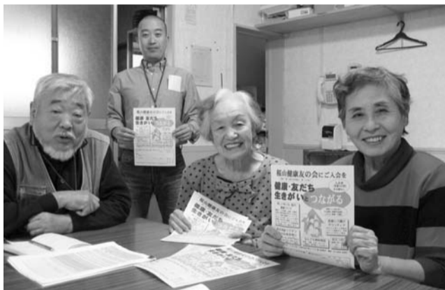
友の会入会をお誘いする訪問に出発。桜山健康友の会の役員と職員