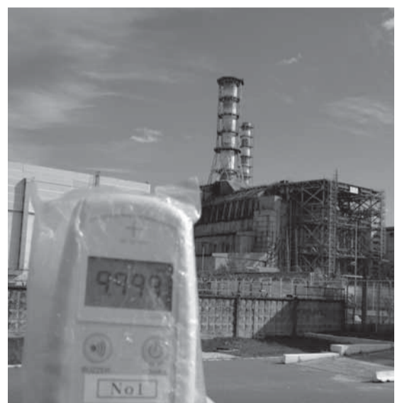
チェルノブイリ原発四号炉。線量計は9.999で点滅