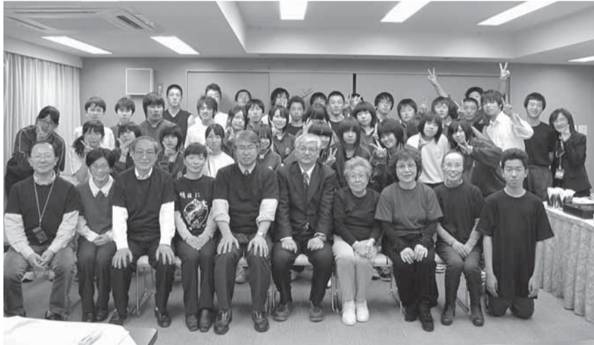
演題発表で使用した写真より。修学旅行で東京に来た、岩手県田老町田老第一中学校の生徒と再会し記念撮影。健友会職員・友の会員は、支援のために販売活動を行っている「田老Tシャツ」を着て出迎えた

ことがわかりました。各地の原発ゼロへの取り組みなども紹介され、勇気や元気をもらいました。私達はもっと学習し、しっかりとした知識をもつこと、地域のコミュニケーションを大事にし、一人ひとりが意思表示する機会に感謝します。