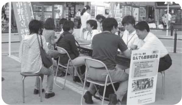
2012年9月の相談会風景

皆さんのまわりに困っている方、どこに相談していいのか悩んでいる方がおられましたら、ぜひご紹介ください。