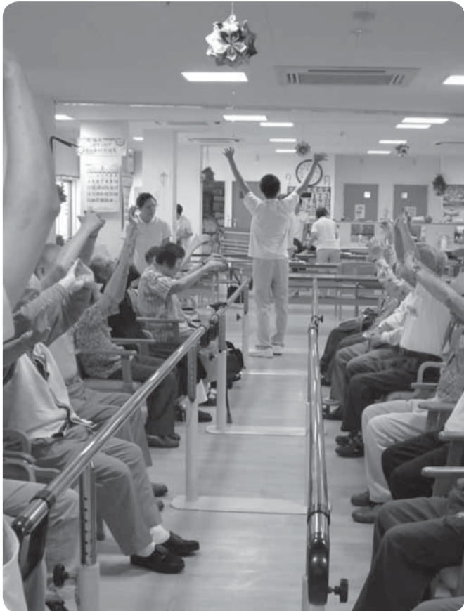
昼食後の集団体操です

通所リハビリは、介護保険サービスの一つです。介護認定された方(要介護1〜5、要支援1〜2)を対象に、利用者さんがこの地域の中で元気に過ごせるよう、心身の機能の維持・向上のため