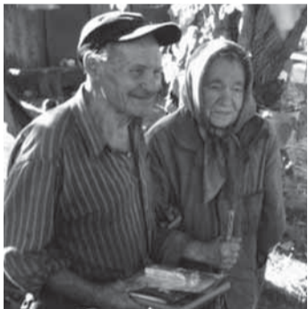
居住禁止区域に戻って暮らすご夫婦