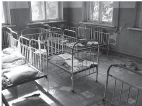
廃墟の幼稚園。小さなベッドが並んでいた