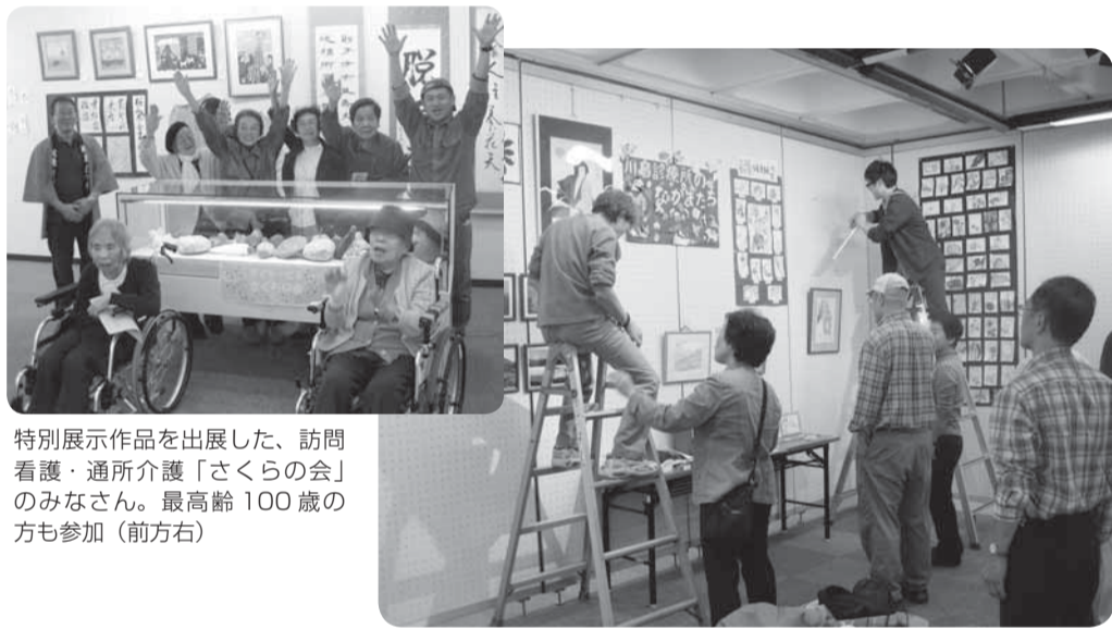
特別展示作品を出展した、訪問看護・通所介護「さくらの会」のみなさん。最高齢100歳の方も参加(前右)

10月24日〜26日、なかのZEEO(西館)美術ギャラリー1階。 友の会のみなさんの手で、会場設定と、大切な作品をていねいに展示しました。コーヒー・紅茶も用意され、ゆったりと芸術の秋を堪能。(編集部)