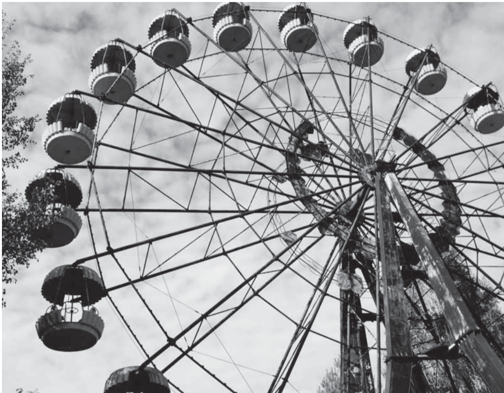
遊園地跡地には観覧車が悲しげにそびえていた（写真の撮影は全て谷川医師）

（注）中野共立病院前は0.08マイクローシーベルト/時（2012年10月23日測定）