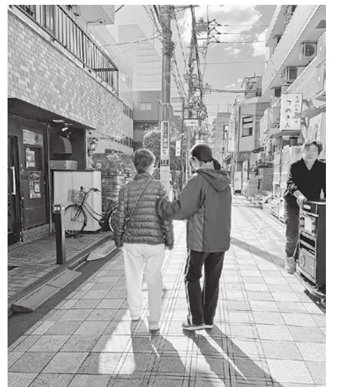
屋外歩行訓練の見守り

要素を取り入れられると効果的ですが、日課となるように提案や工夫をするのは結構難しいです。Bさんのように日々の生活の中で徐々に動作が楽になったり生活の幅が広がるなど、変化を実感してもらえると嬉しいです。健友会では2つの訪問