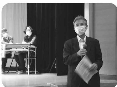
恒例のつどい参加者抽選会では3名の方にQUOカードがあたりました。友の会の各サークルや健康チェック、病院屋上花壇の報告に会員や役員の皆さんが素敵な笑顔で交流しました。