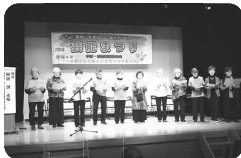
共立コーラス 花水木の合唱