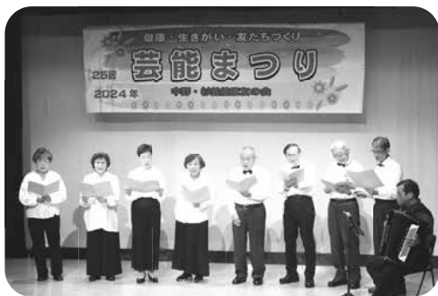
健友会 旧友会のコーラス