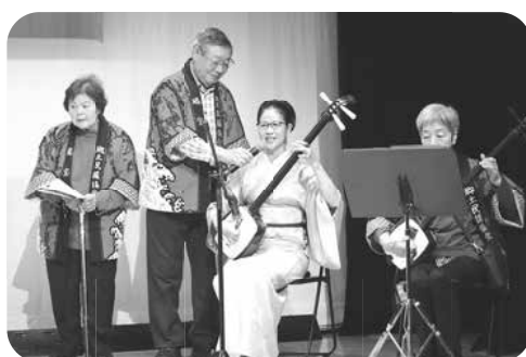
瑞宝会の祇園小唄など