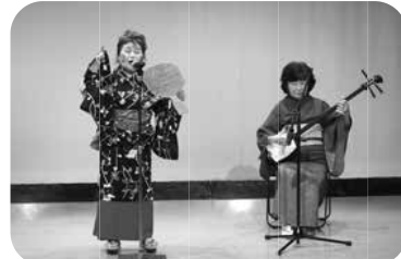
健友会 旧友会のおてもやん とっても楽しく笑顔に!