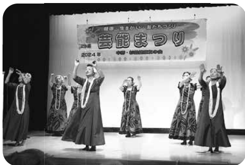
オープニングを飾ったフラダンスサークル