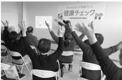
地域の健康チェックでろばん体操

コロナ禍という困難を乗り越え、友の会は前進し始めました。 共立健康友の会はコロナ禍の5年の困難な時期を乗り越え、友の会まつり（作品展や芸能祭り）、共立ミニ健康まつりの成功やサークル活動の再開、毎回数十人参加するウォーキングや元氣班会を開催するなど活発に活動してきました。最近では、「皆さんと交流できる居場所があることって大事と思う」と入会されたという、うれしい声も聞かれるようになってきました。