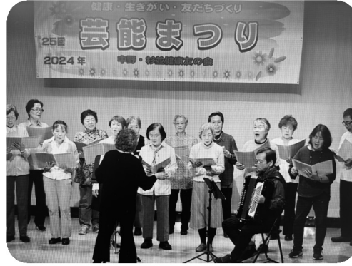
芸能まつりで コーラスサークル