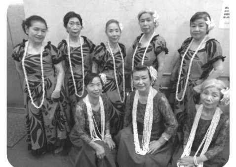
フラダンスサークル