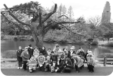
健康ウォーキング