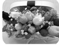
手芸サークル：魔法の一本針

日時：5月21日(水)13:00開場 会場：なかの芸能小劇場 議事：2024年度活動・決算報告 2025年度活動方針・予算案 アトラクション・みんなでうた