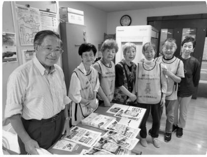
ミニミニ健康チェック