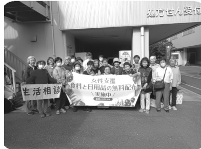
女性支援食料と日用品無料配布