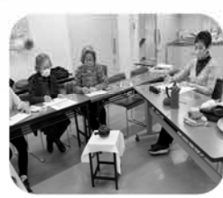
スケッチサークル