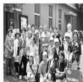
登戸平和バスツアー