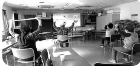
ころばんセラバン体操