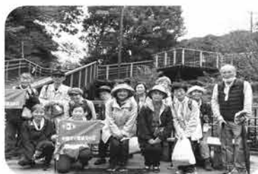
健康ウォーキング