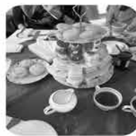
英会話 アフタヌーンティー