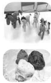
手芸サークル:魔法の一本針