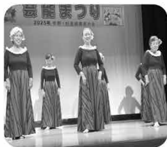
フラダンスサークル