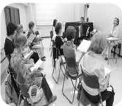
コーラスサークル